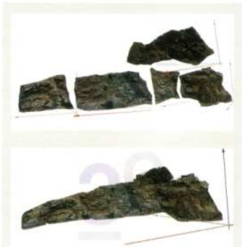
Fünf einzelne 3D-Bilder eines Felsaufschlusses (oben) werden zu einem einzigen 3D-Bild zusammengeführt (unten).