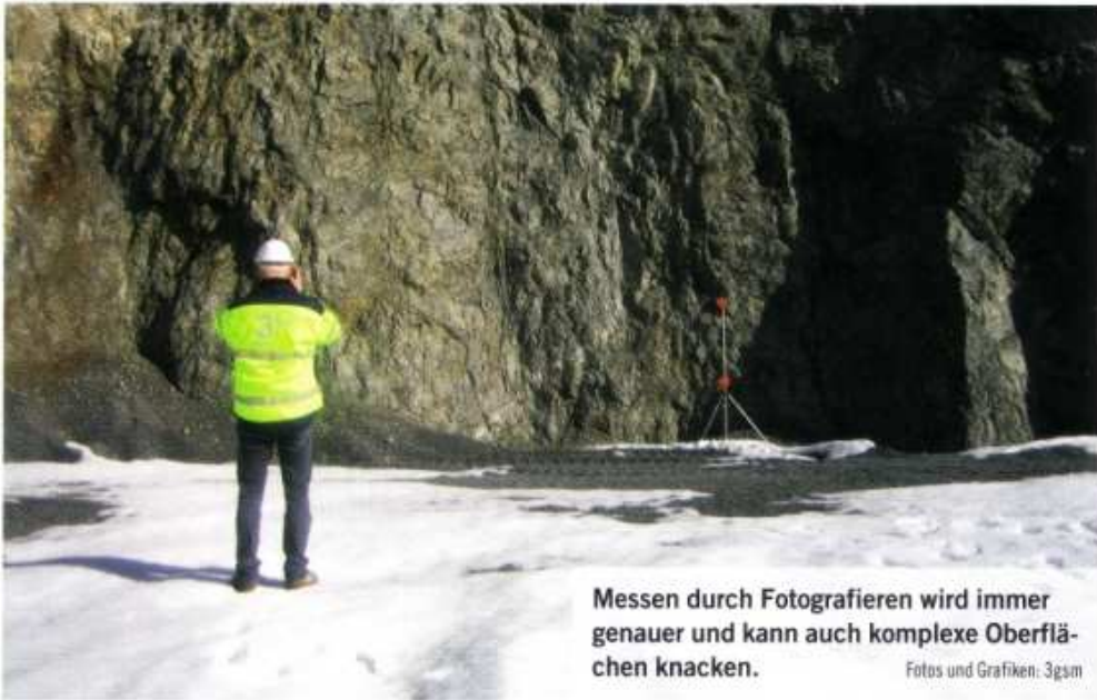
Messen durch Fotografieren wird immer genauer und kann auch komplexe Oberflächen knacken.